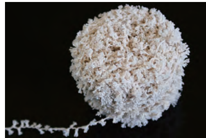
似里 力 Chikara NISATO 1968年生まれ 岩手県在住 無題 / 制作年不詳