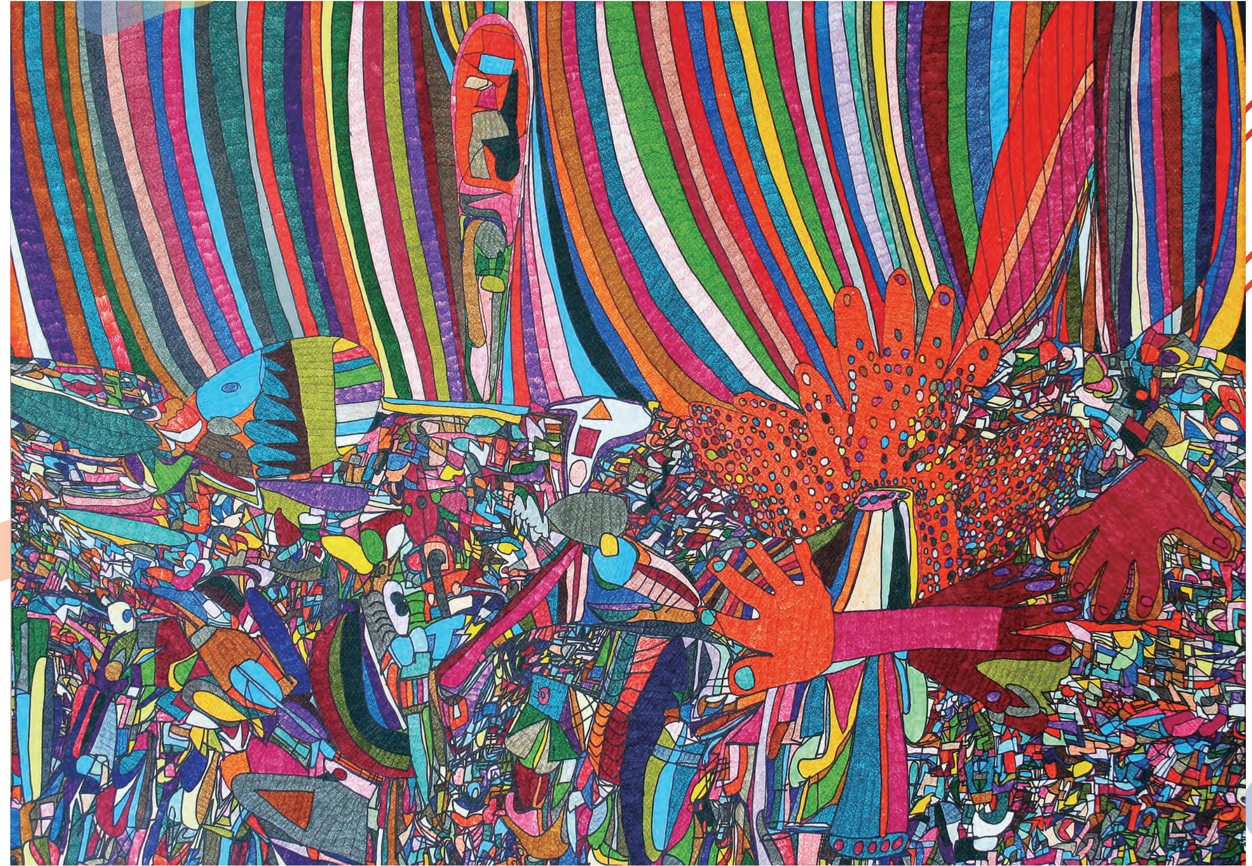
八重樫 道代「カウントダウン21世紀」制作年不詳