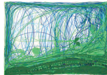
柴田 鋭一 Eiichi SHIBATA 1970年生まれ 埼玉県在住 せっけんのせ / 2008年